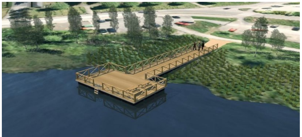
Giver får sitt navn på en sponsorplate som blir stående for alltid på bryggen

«Dette er en sak og gave som vil få positiv omtale. Det vil være en fin måte å få profilert klubben i nærmiljøet».